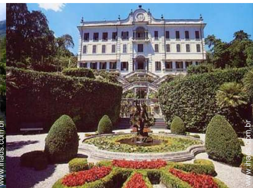
Atrações e lazer