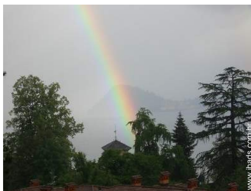
vista para lago