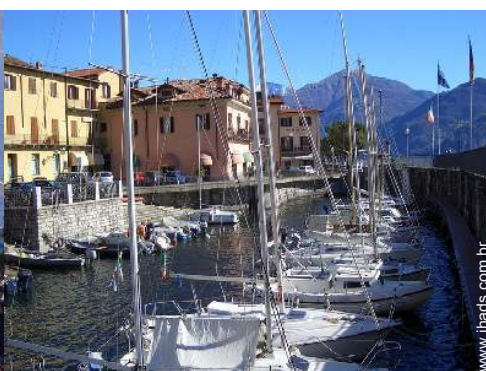
passadiço flutuante para barco