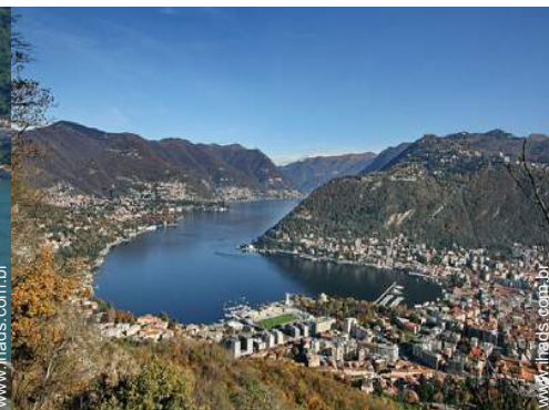
Cidades nas proximidades