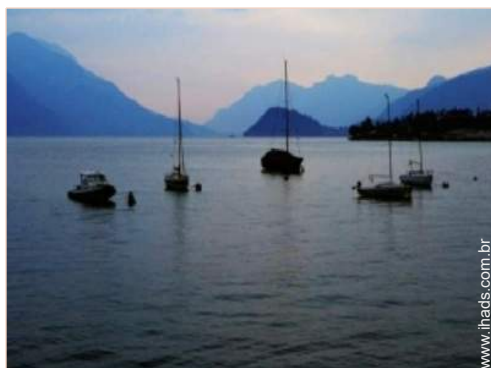
vista para lago