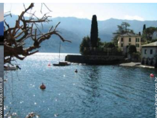
vista de serra