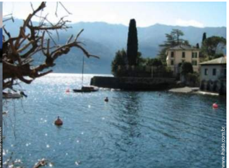
vista de serra