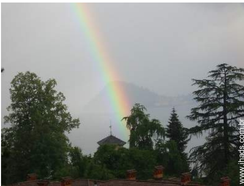
vista para lago