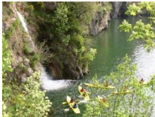
atividades náuticas nas proximidades