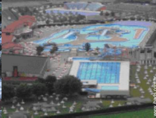
atividades balneares nas proximidades