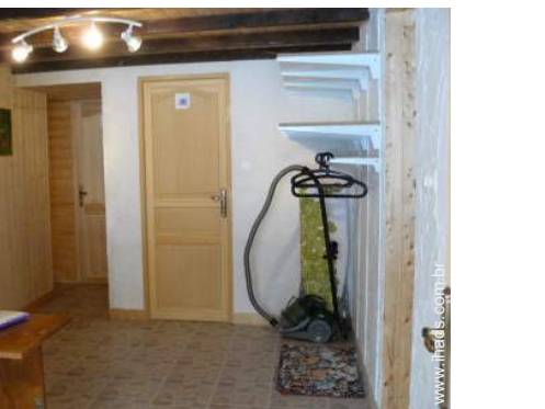
tratamento de roupas