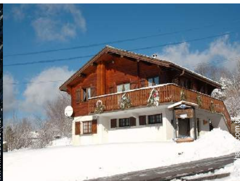
Chalé de Montanha