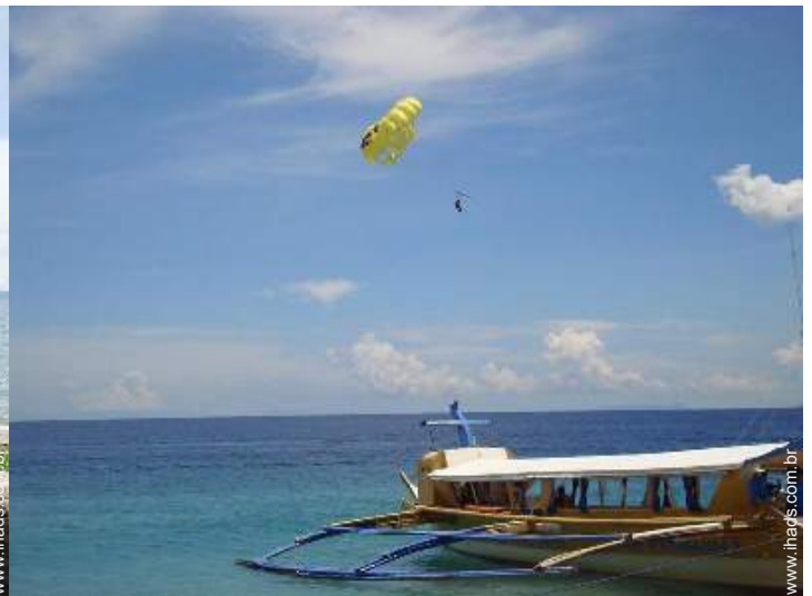
atividades balneares nas proximidades