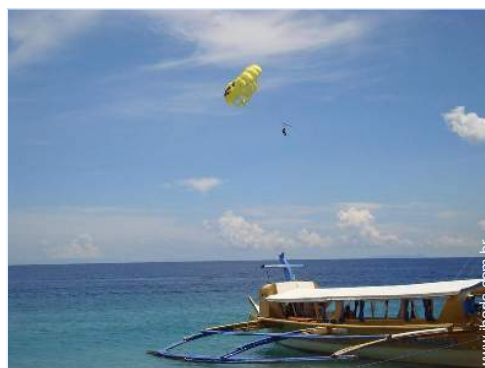
actividades balneares nas proximidades