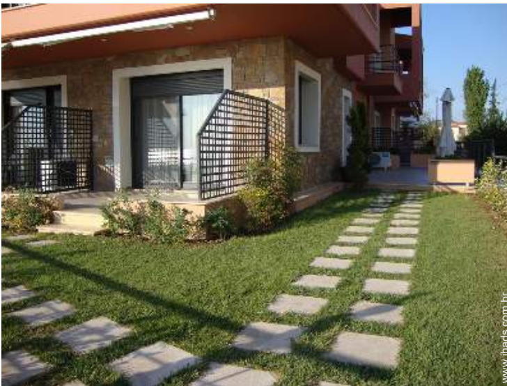
Estúdio de Encanto