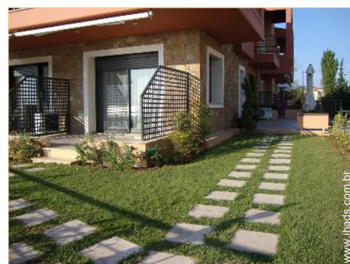
Estúdio de Encanto