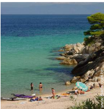
barco a remos