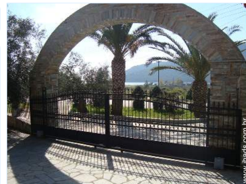
vista a partir da varanda