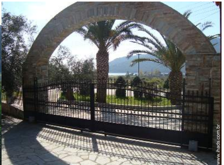
vista a partir da varanda