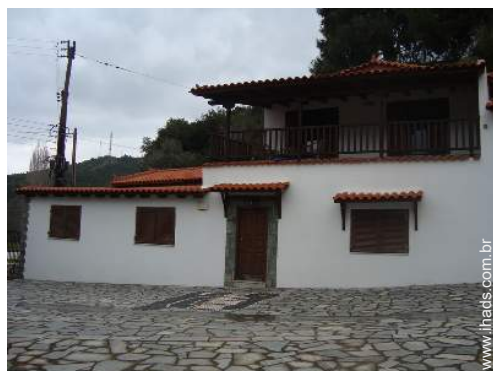
Casa de campo