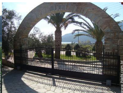
vista a partir da varanda