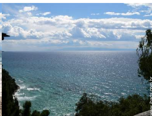
caminho de passeio