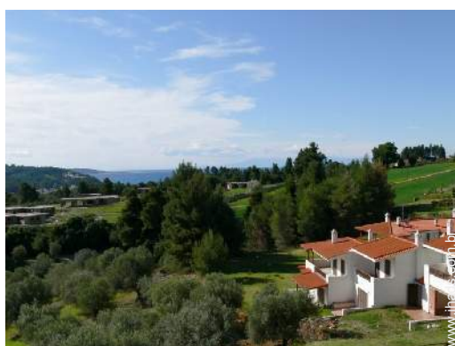
vista a partir do varandim