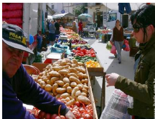
centro da cidade