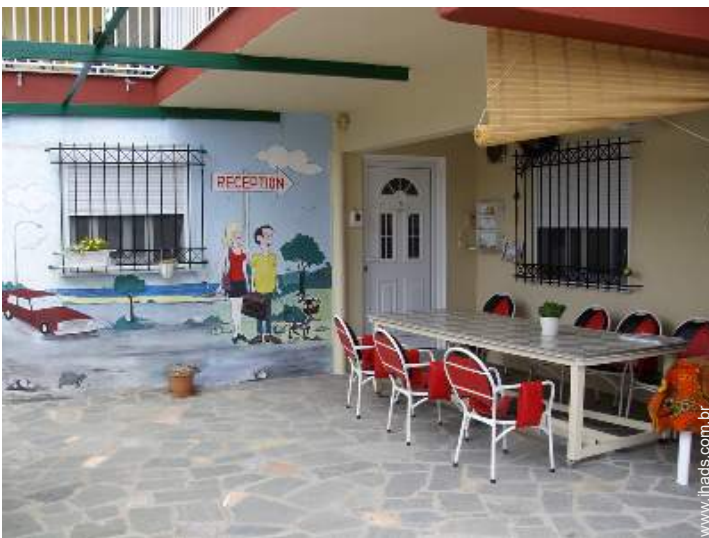
quarto do proprietário