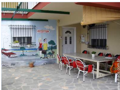
quarto do proprietário