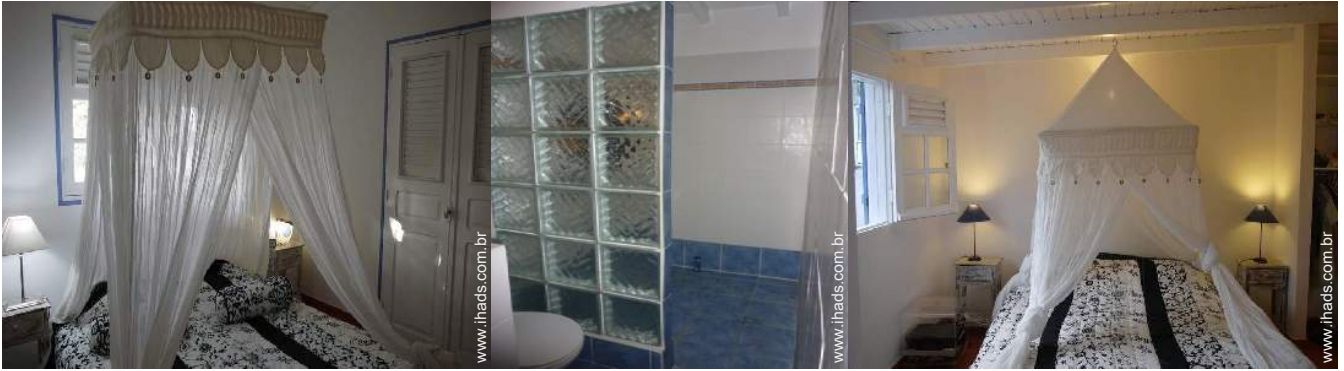
quarto do proprietário