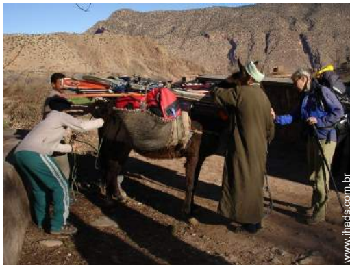
passeio de esqui