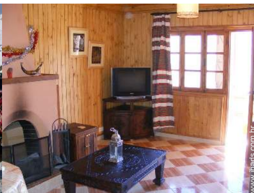
Chalé de montanha de Luxo