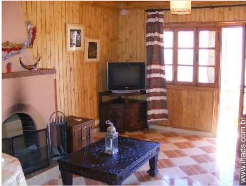
Chalé de montanha de Luxo