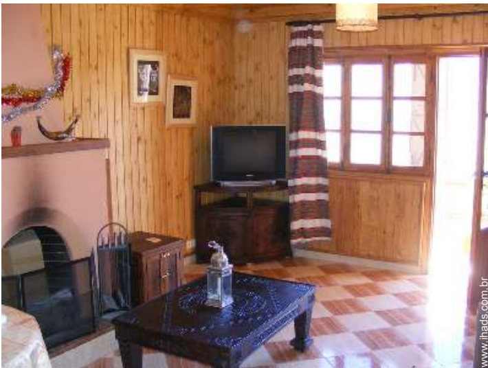
Chalé de montanha de Luxo