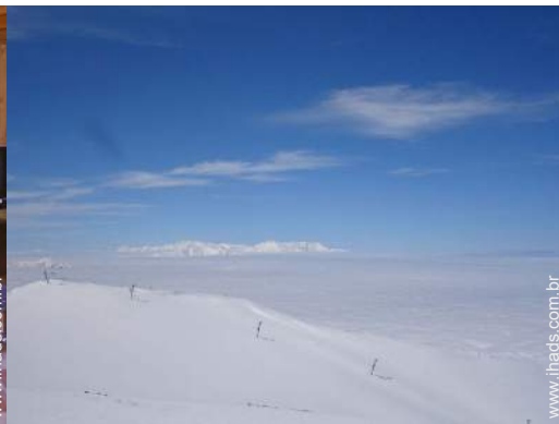
pistas de esqui