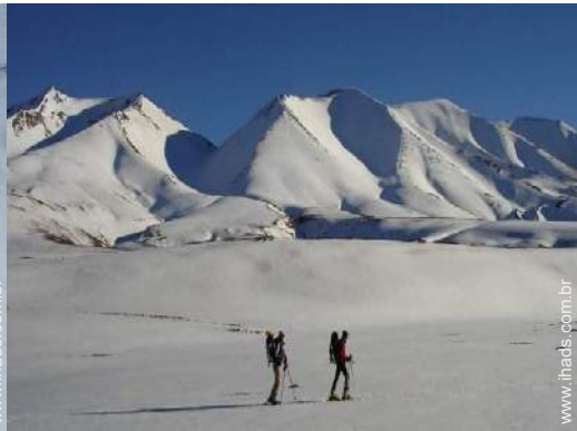
esqui de fundo