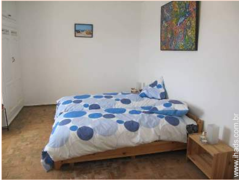
quarto de amigos