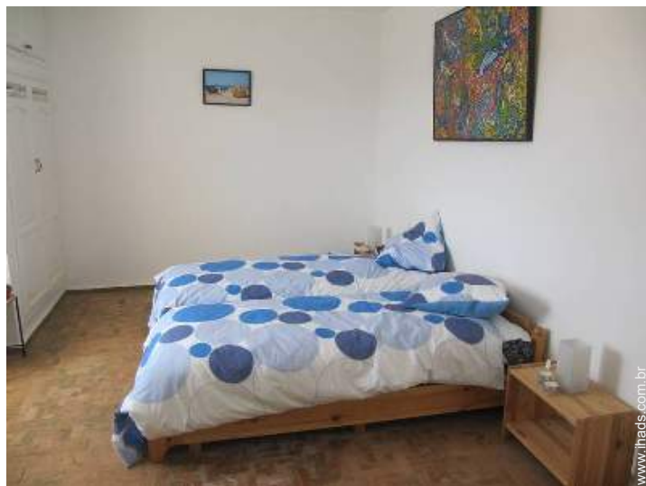
quarto de amigos