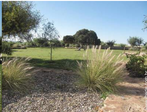
vista a partir do terraço coberto