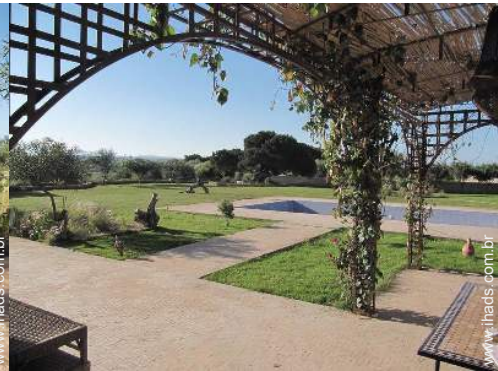
vista a partir do terraço coberto