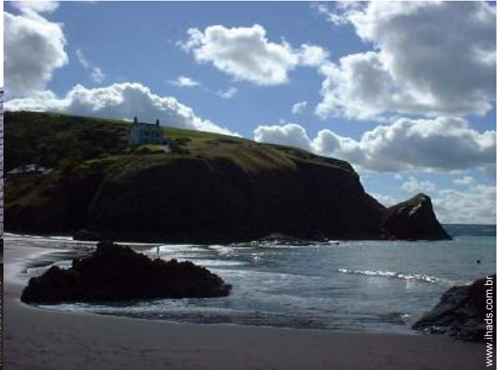
atividades balneares nas proximidades