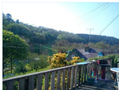
vista a partir do pátio