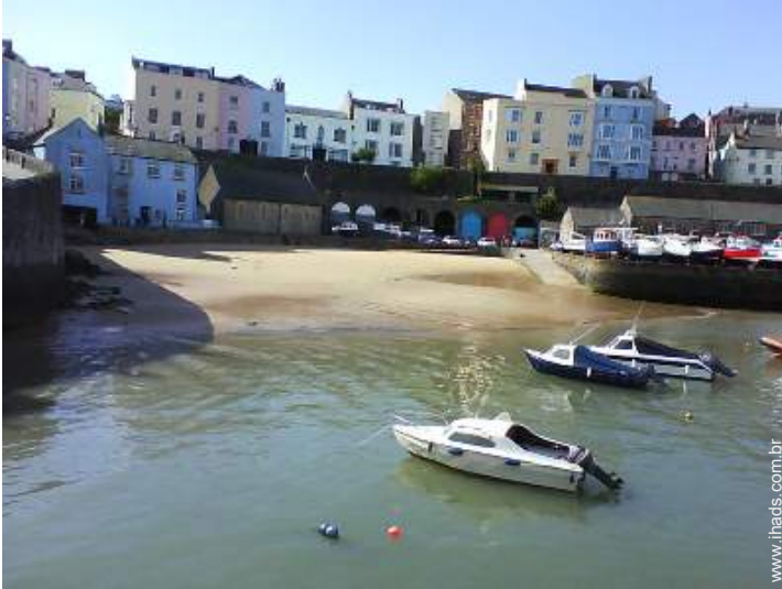
atividades nas proximidades