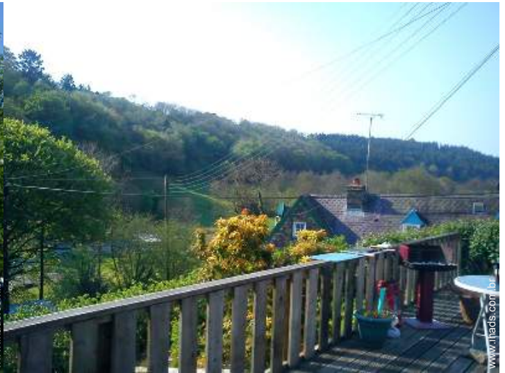
vista a partir do pátio