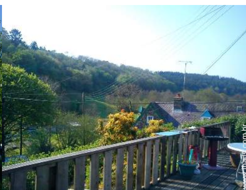
vista a partir do pátio