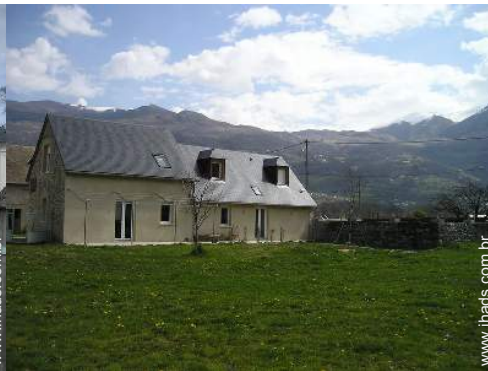
vista para pradaria