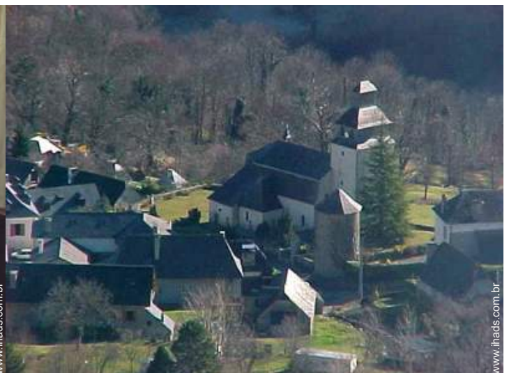
vista centro aldeia