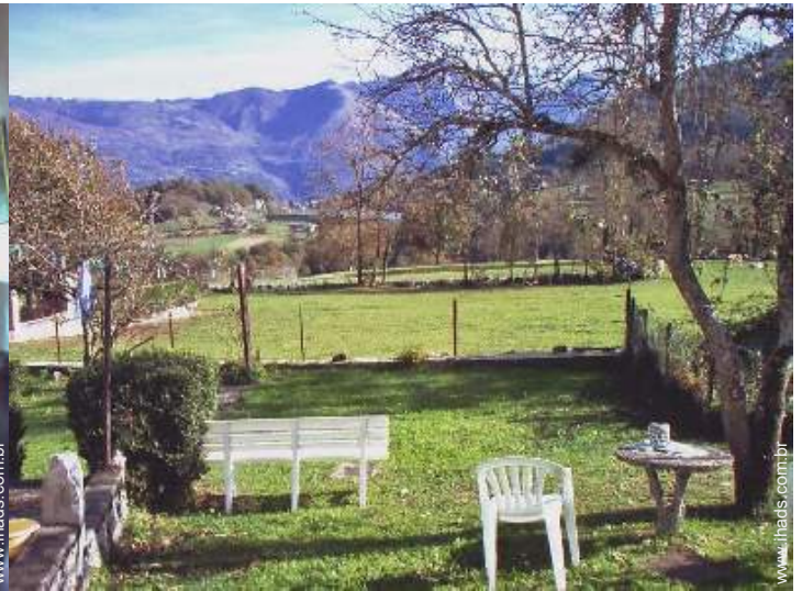
vista para lago