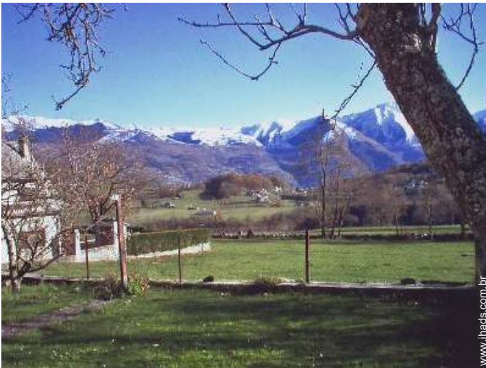
vista de serra