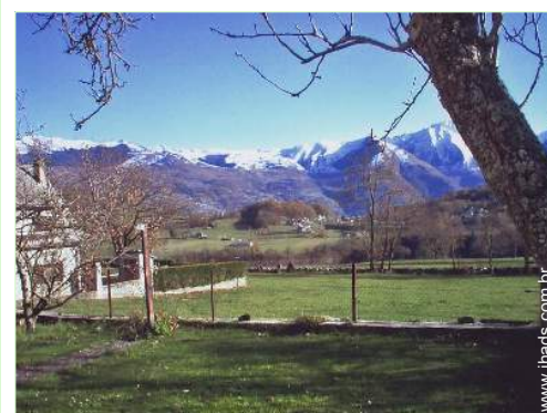
vista de serra