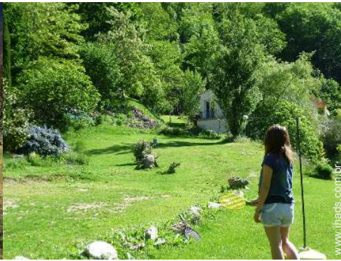
Equipamentos de lazer