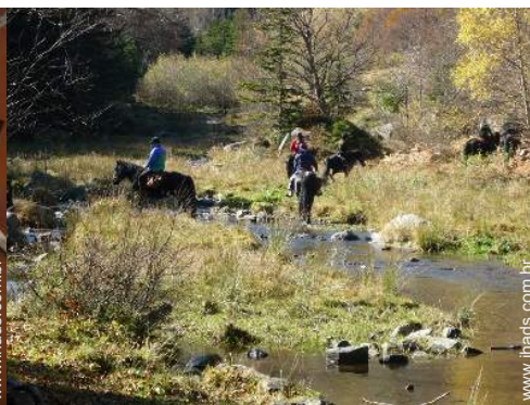
passeio a cavalo