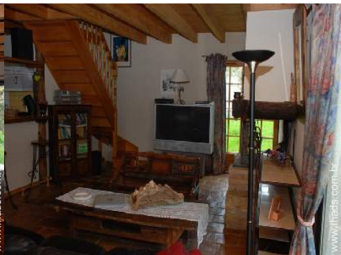
cinema em casa