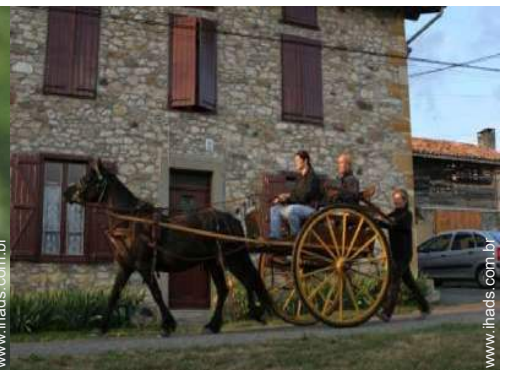
passeio a cavalo