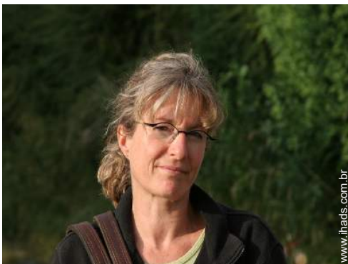
Os seus hóspedes