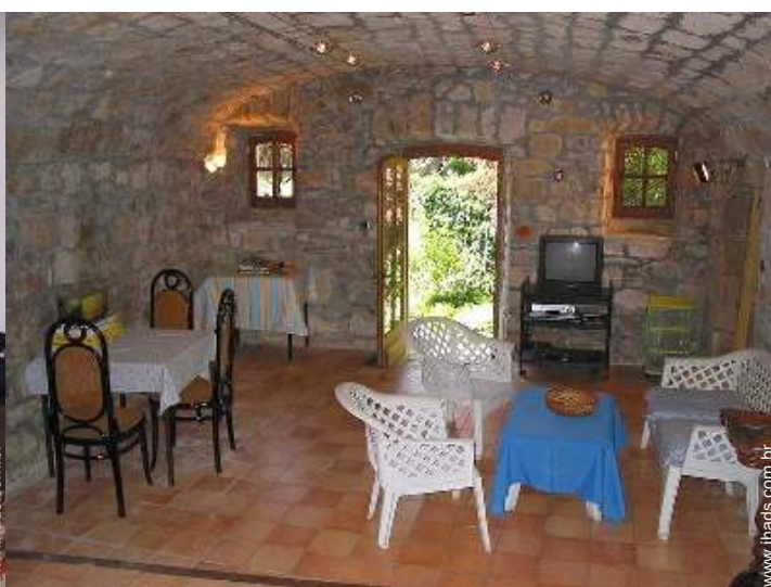
salão de jogos