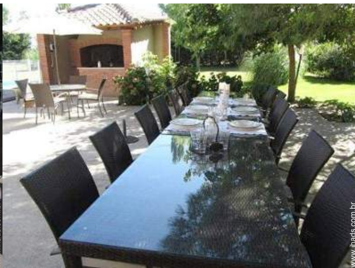
Equipamentos exteriores à disposição dos hóspedes