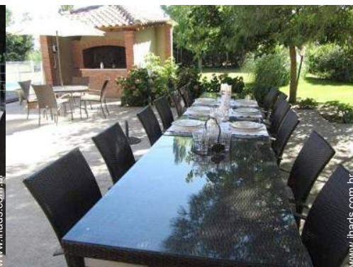
Equipamentos exteriores à disposição dos hóspedes