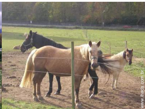
animais da quinta