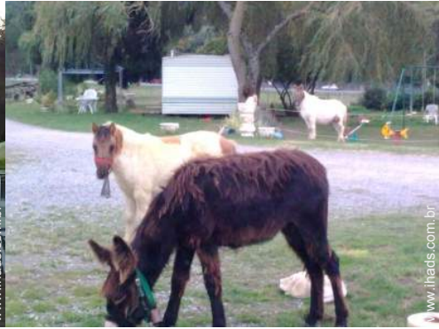
Os animais da casa