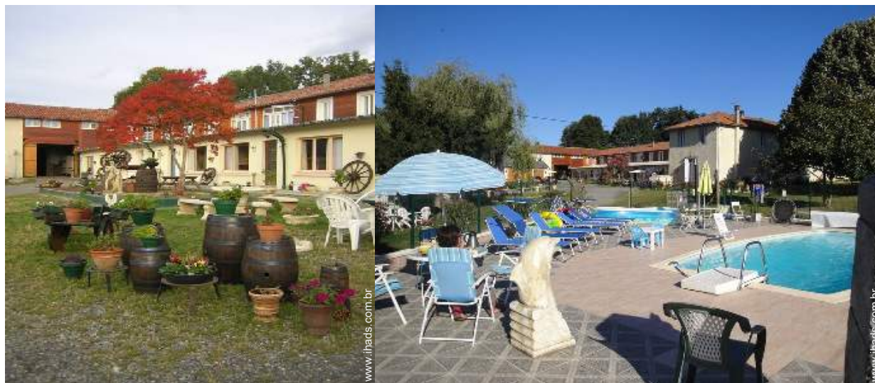
Antiga casa agrícola