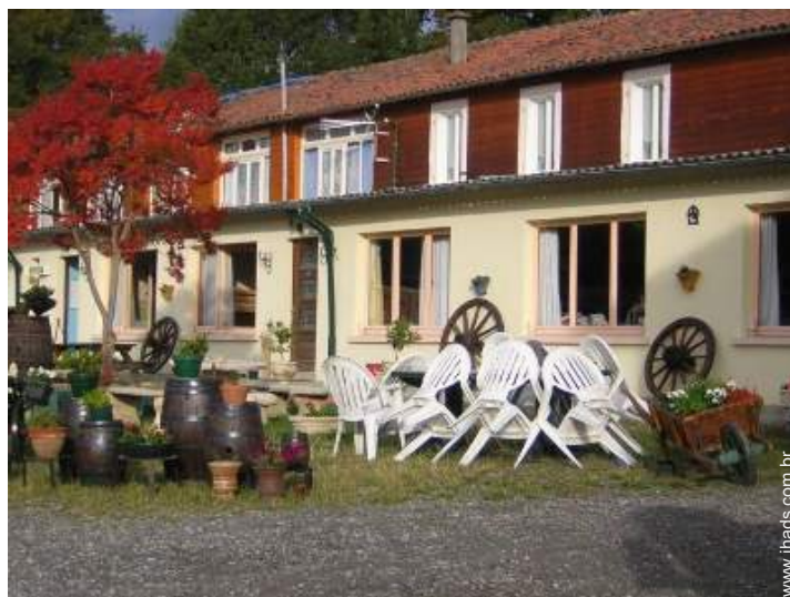
Antiga casa agrícola