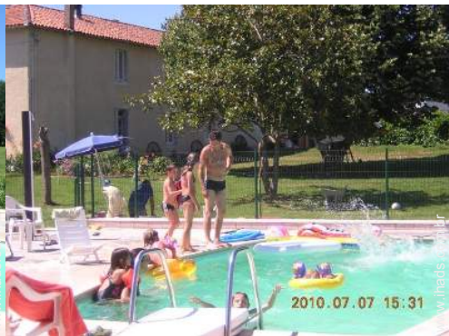
piscina na residência