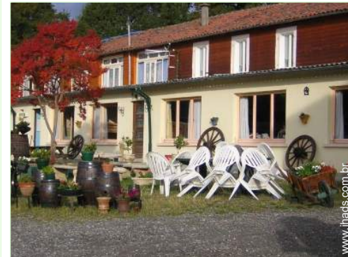
Antiga casa agrícola