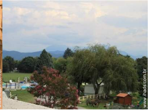
vista a partir do apartamento