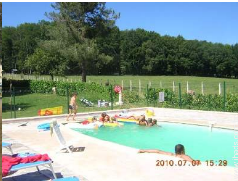
piscina na residência