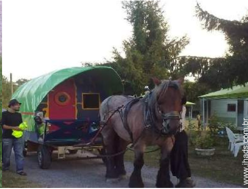
Os seus hóspedes