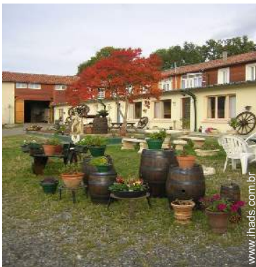
Antiga casa agrícola