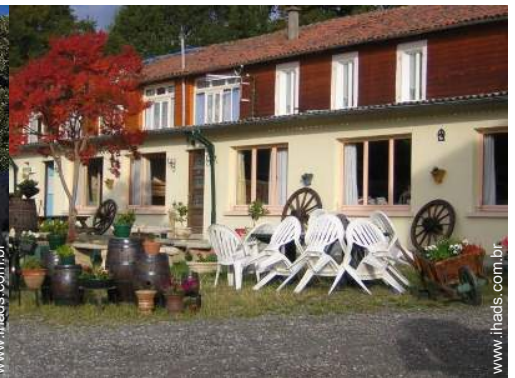
Antiga casa agrícola