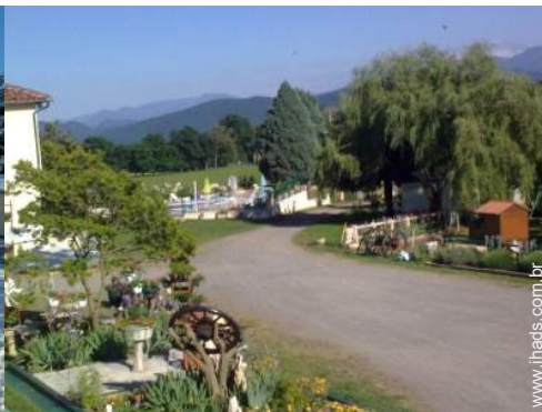
vista de serra