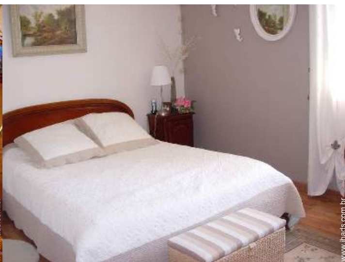
quarto do proprietário