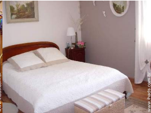
quarto do proprietário