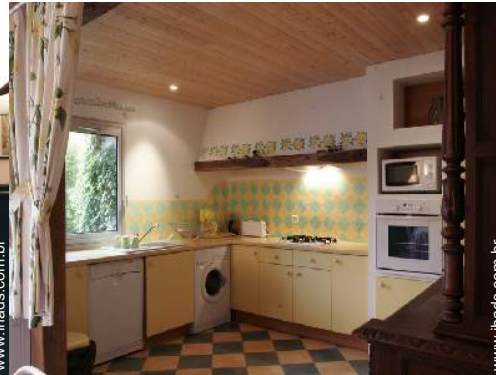
grande cozinha americana