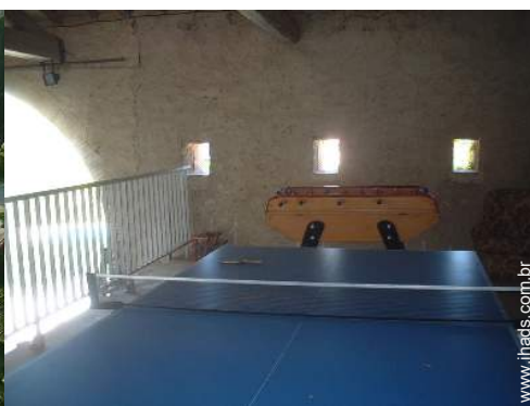
mesa de ping-pong