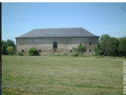
vista para pradaria