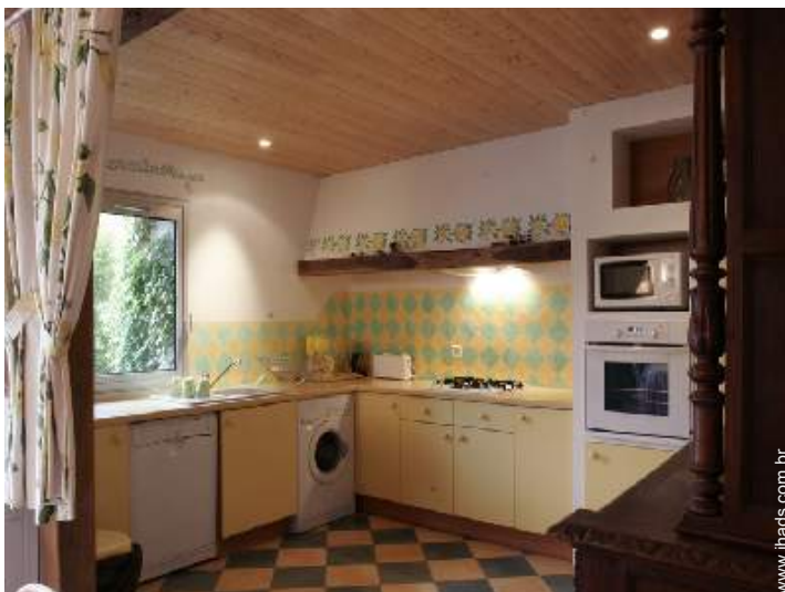
grande cozinha americana