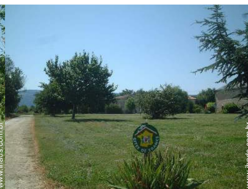
Ambiente exterior à disposição dos hóspedes