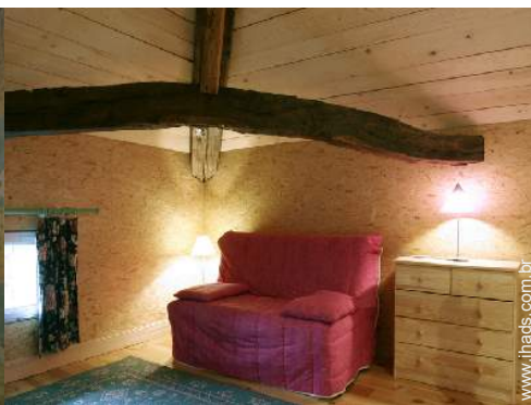
cama(s) convertível/eis dupla(s)