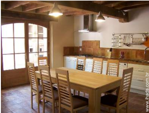
grande cozinha americana