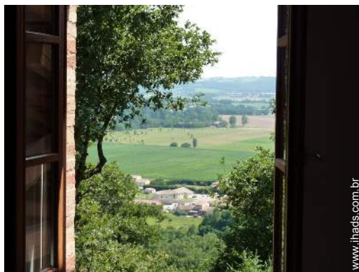
vista de campo