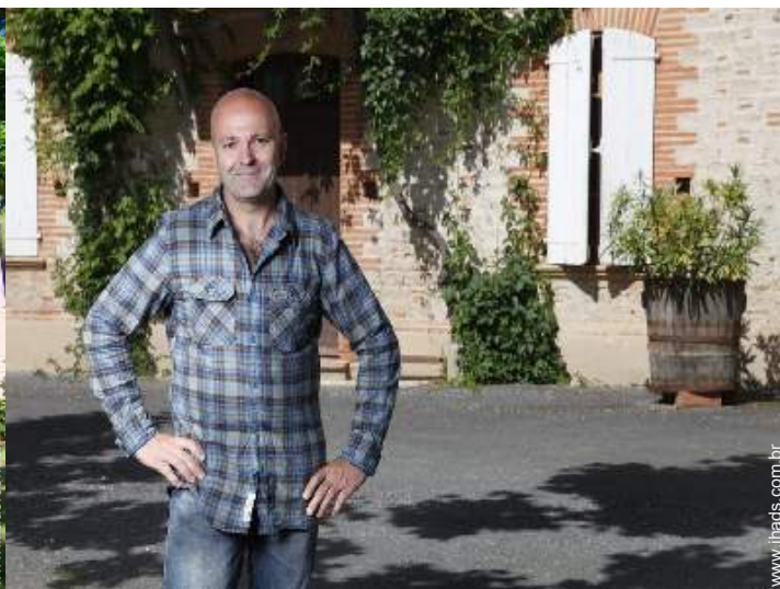
O seu hóspede