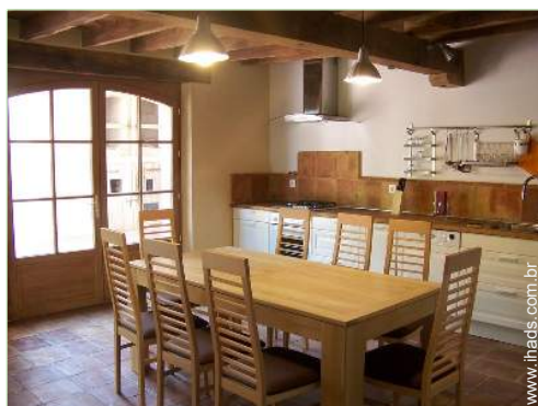
grande cozinha americana

Cadeira de bebé, banheira bebé, bacio bebé