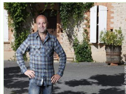
O seu hóspede