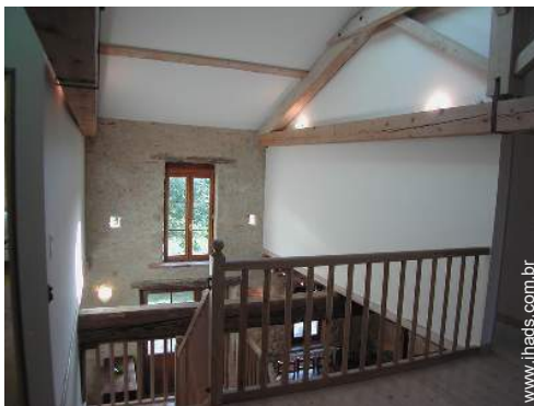
vista a partir da mezzanine