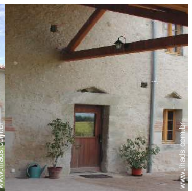
vista a partir do terraço coberto