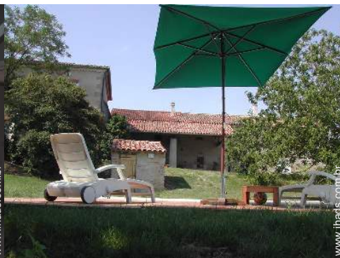
vista a partir da piscina