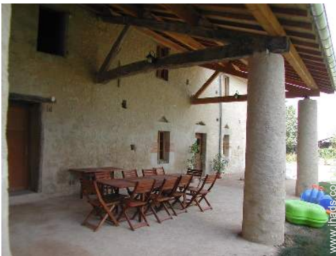
mesa(s) de jardim