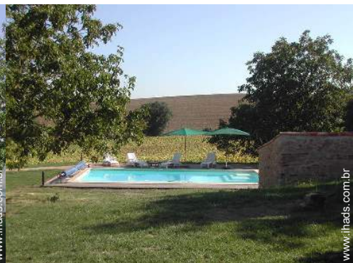
vista a partir do terraço coberto