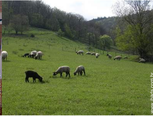
animais da quinta