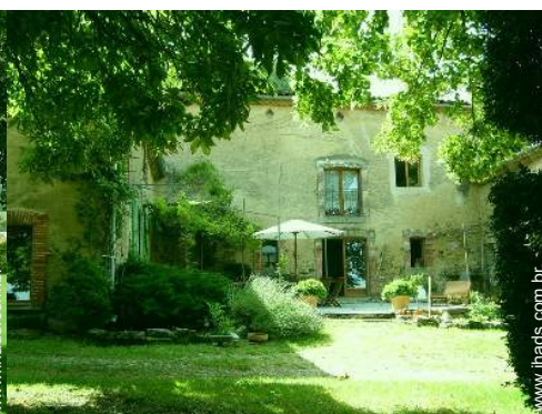
Os seus hóspedes