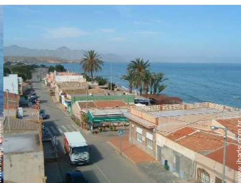
Casa de Encanto de pescador