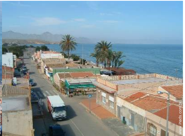
Casa de Encanto de pescador