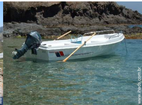
actividades náuticas nas proximidades