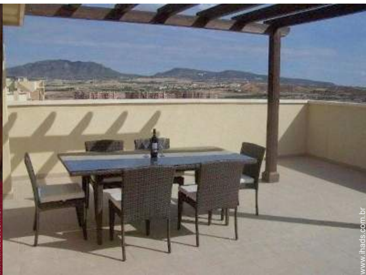
terraço no telhado