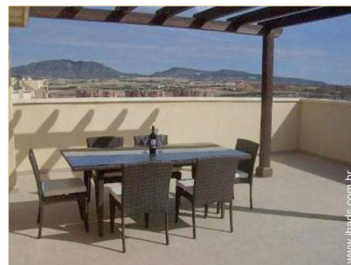
terraço no telhado

Barbecue, mesa(s) de jardim, cadeira(s) de jardim, guarda-sol, cadeira(s) de praia