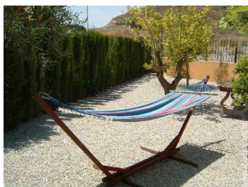
cama de rede