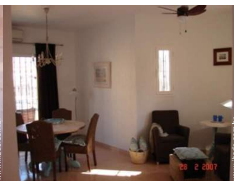
Divisões e comodidades