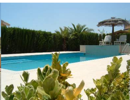
vista sobre piscina