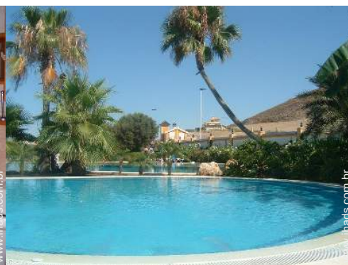
atividades de verão nas proximidades