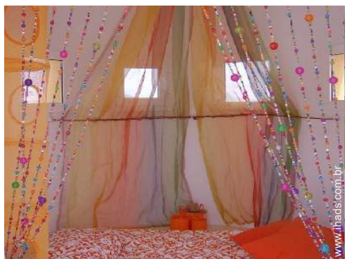
Dormida - cama(s)