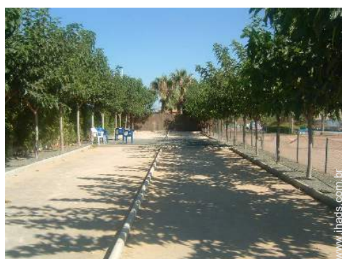
terreno de petanca