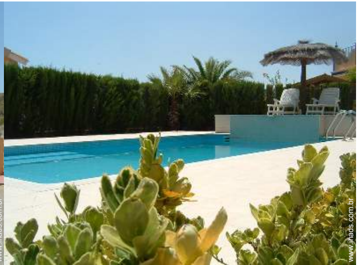
vista sobre piscina