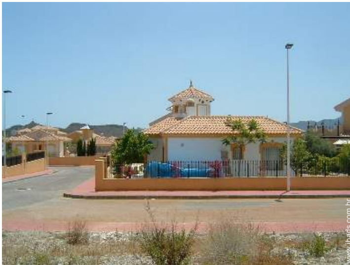
visão de conjunto