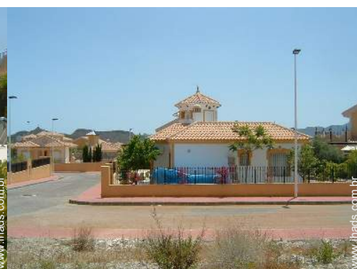
visão de conjunto