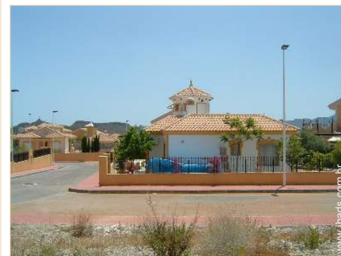
visão de conjunto