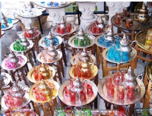
loja de artesanato