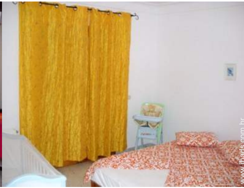
Equipamentos para bebés