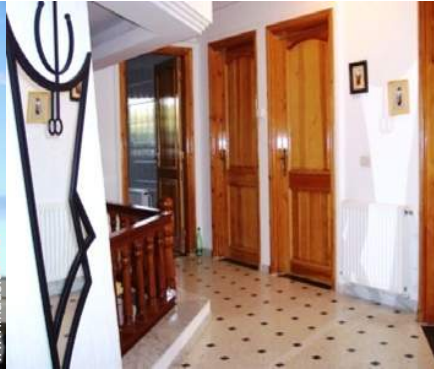
vista a partir do pátio