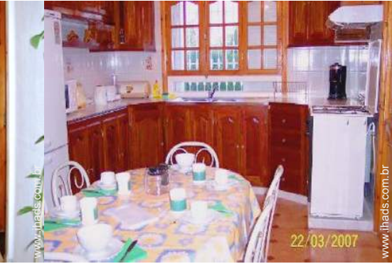
grande cozinha independente