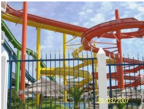
actividades nas proximidades