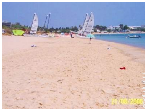
actividades náuticas nas proximidades