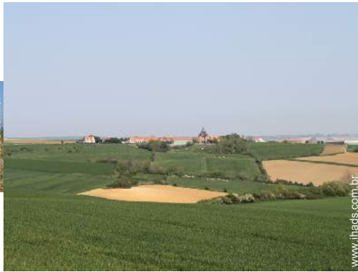
caminho de passeio