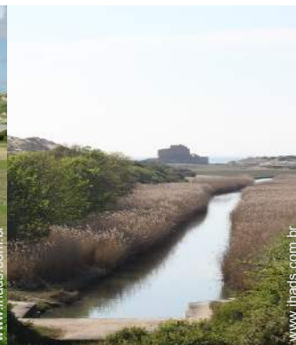
vista para rio