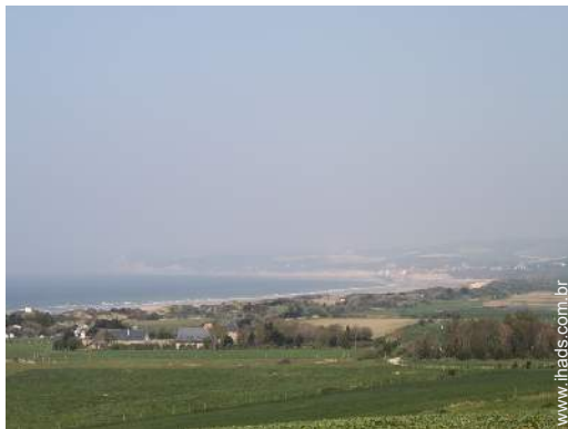
caminho de passeio