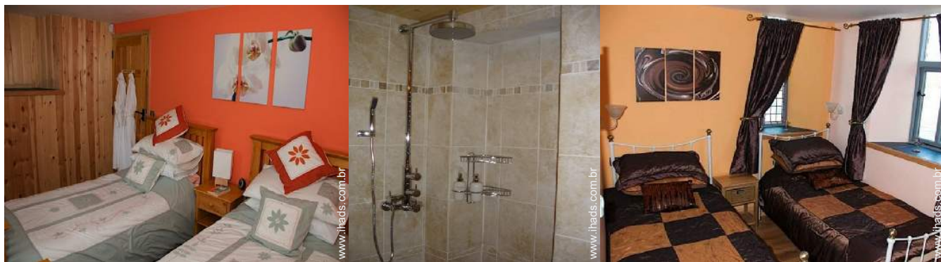
camas separadas simples