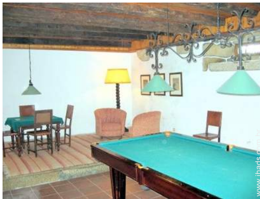
salão de jogos