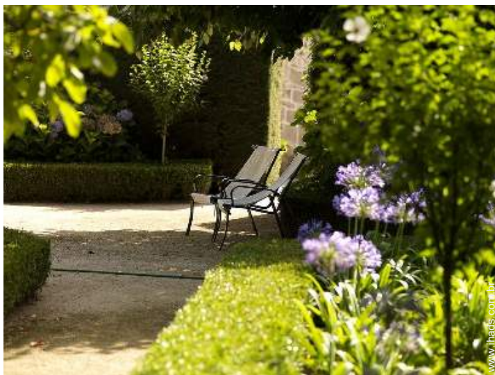
infraestruturas de lazer