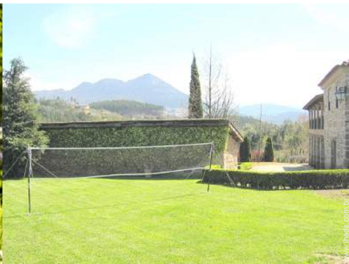
Equipamentos de lazer