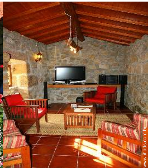
salão de música