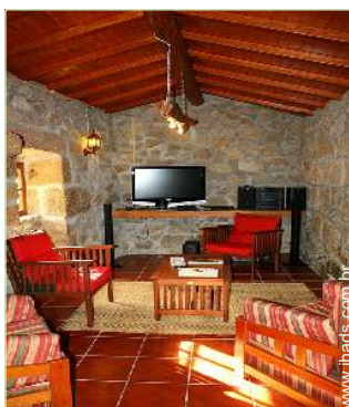
salão de música