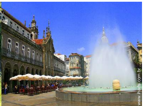
Cidades nas proximidades