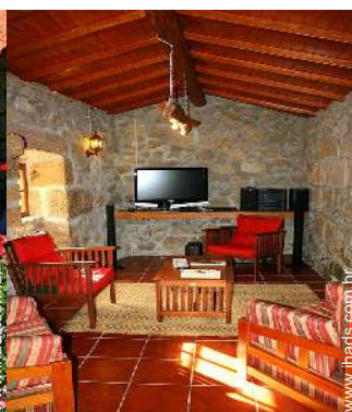
salão de música