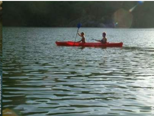
atividades náuticas nas proximidades