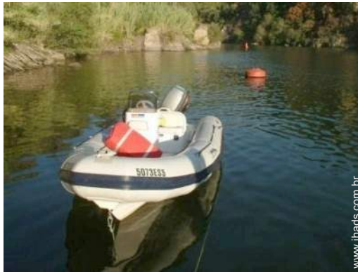
barco a motor