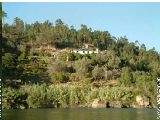
Propriedade de Encanto