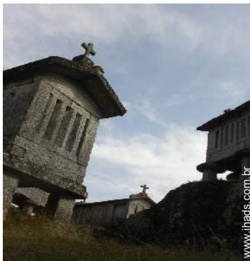
Atrações e lazer