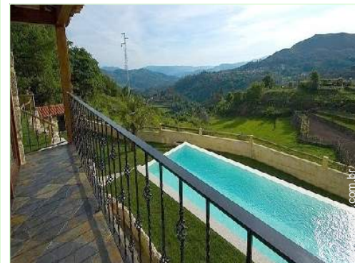
vista de serra