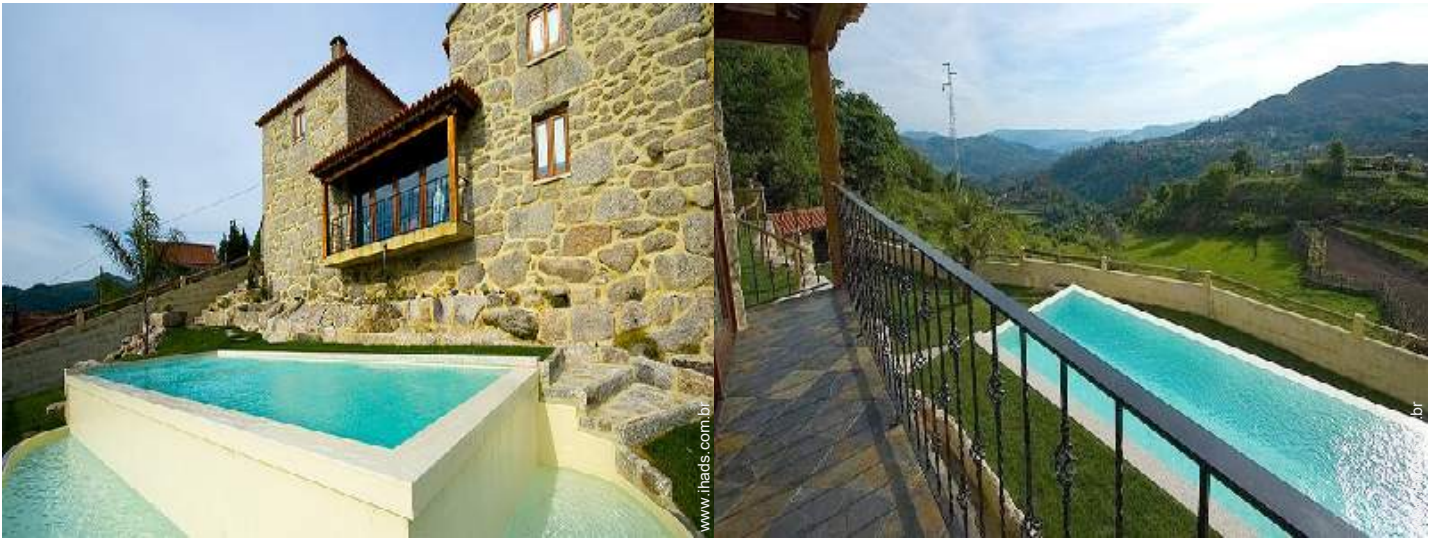
vista de serra