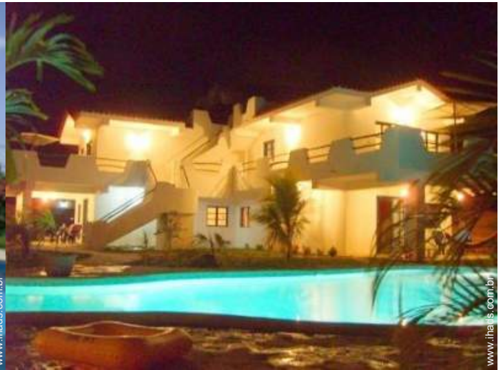
Propriedade de Encanto