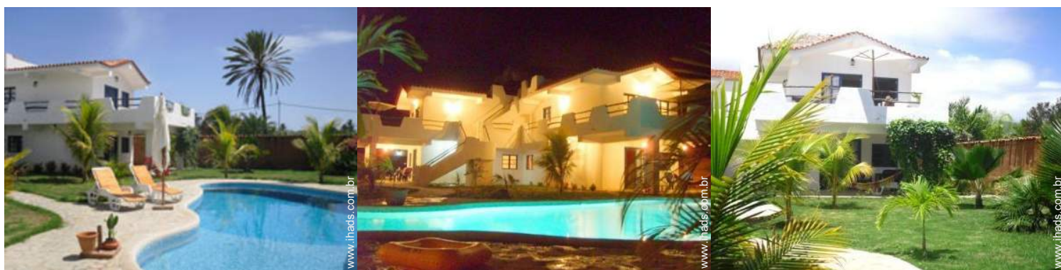
Propriedade de Encanto