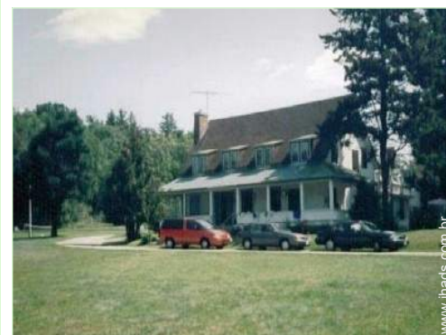
Casinha de campo de Encanto