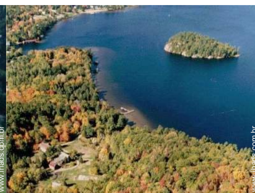
Casinha de campo de Encanto