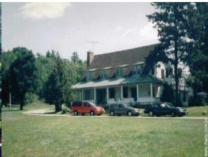
Casinha de campo de Encanto