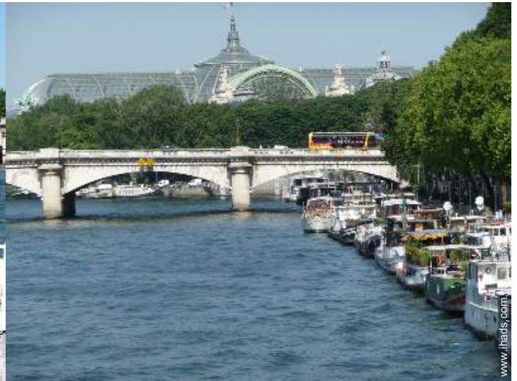
vista de porto