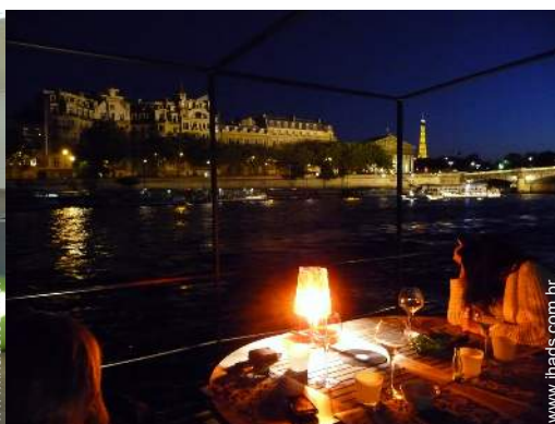
vista sobre monumento