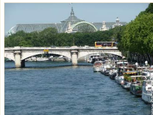
vista de porto