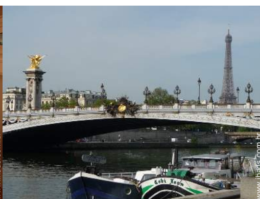
vista de porto