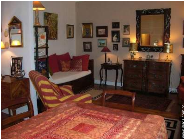
cama(s) convertível/eis dupla(s)