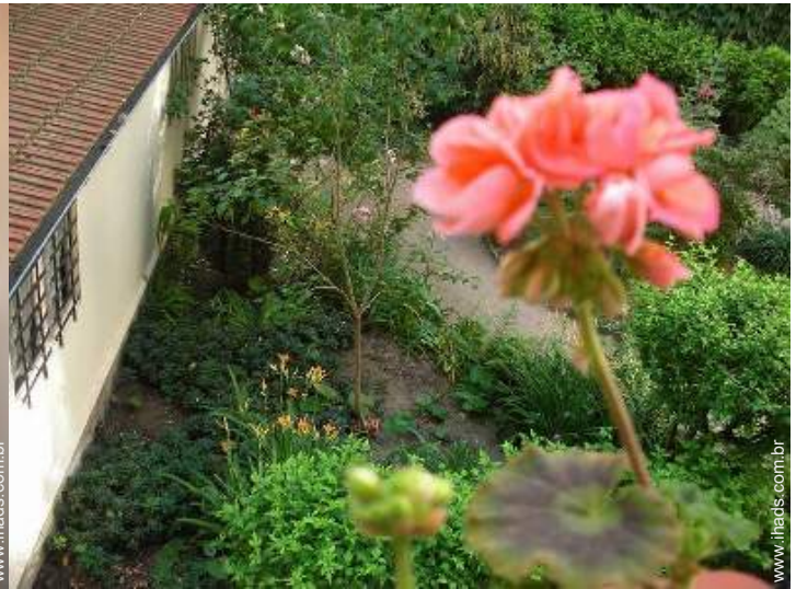
vista a partir do apartamento