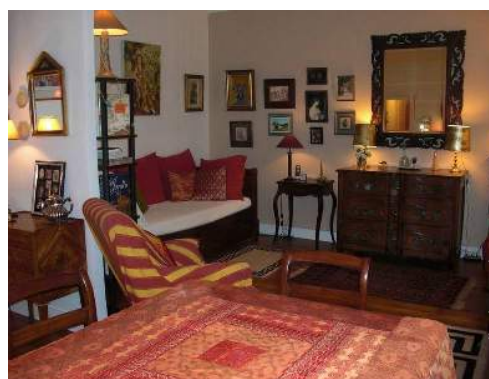
cama(s) convertível/eis dupla(s)