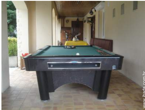
vista a partir do pátio