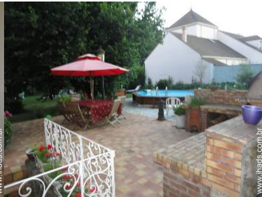
vista a partir da piscina