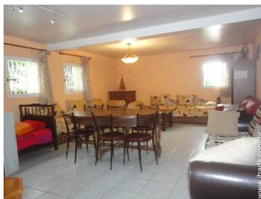
vista a partir da sala de estar