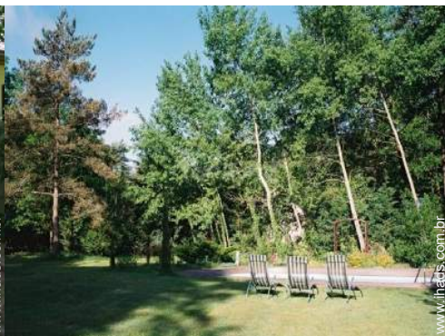
parque e jardim