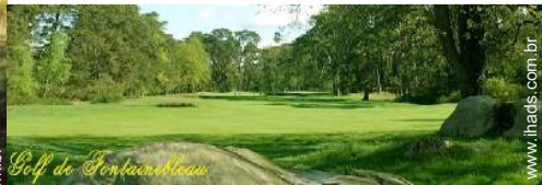
campo de golfe 18 buracos