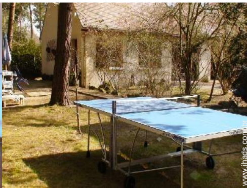
Instalações exteriores à disposição dos hóspedes