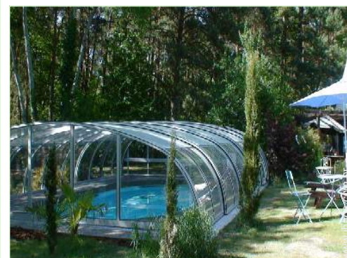
Equipamentos exteriores à disposição dos hóspedes