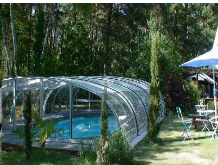
Equipamentos exteriores à disposição dos hóspedes