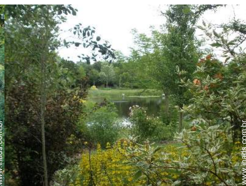
vista para lago