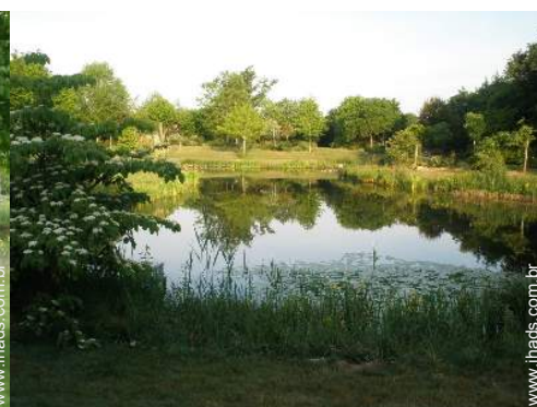
vista para lago