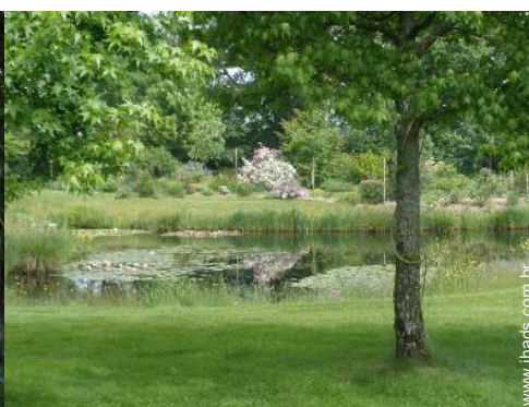
vista para lago