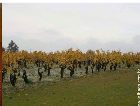
vista sobre vinhas