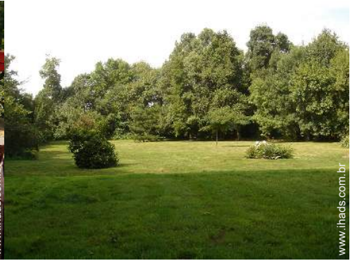
Ambiente exterior à disposição dos hóspedes