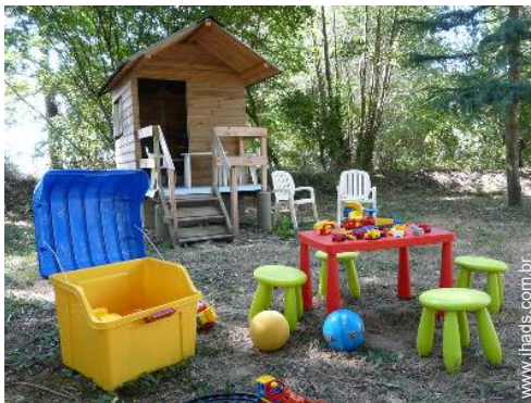
Equipamentos exteriores à disposição dos hóspedes