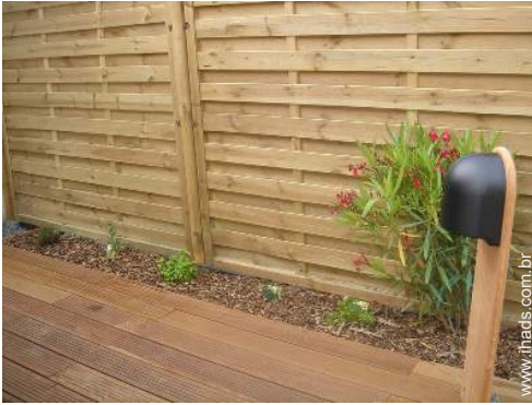
Instalações exteriores à disposição dos hóspedes