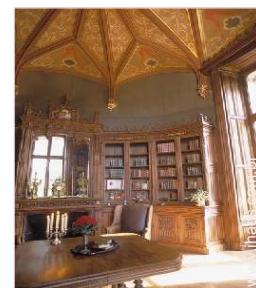
Divisões interiores à disposição dos hóspedes