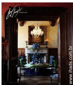
Divisões interiores à disposição dos hóspedes