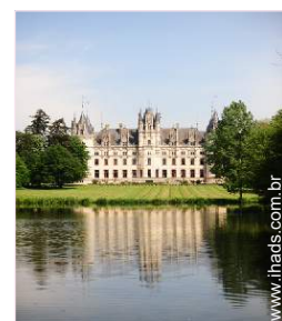
Ambiente exterior à disposição dos hóspedes