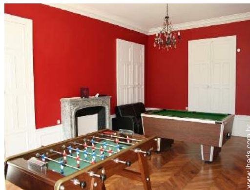
salão de jogos