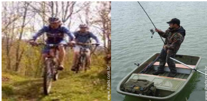
BTT (itinerário circuito)